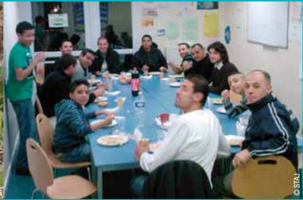
Réunion préparatoire au départ.