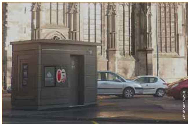
Des toilettes neuves et modernes dans le centre-ville.