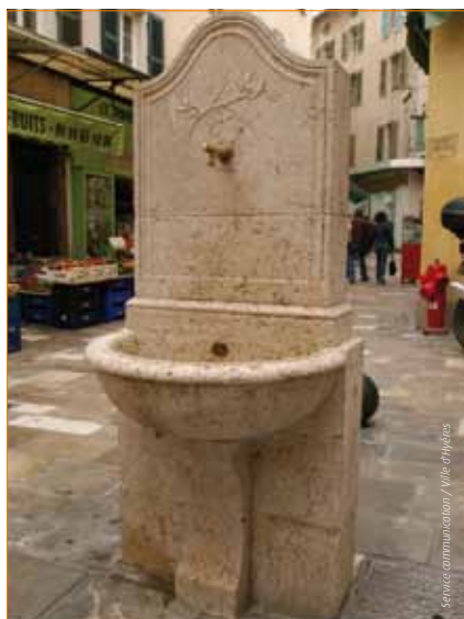
Cette fontaine se déclenche par une pression du pied évitant ainsi les pertes d'eau.