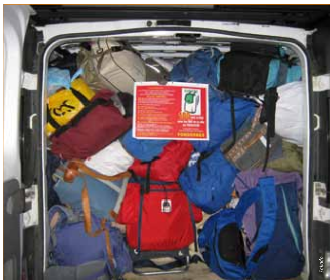
Quatre kits : hygiène, chaleur, culture, festif dans un sac.