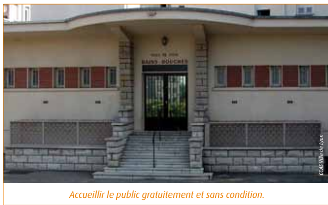
Accueillir le public gratuitement et sans condition.