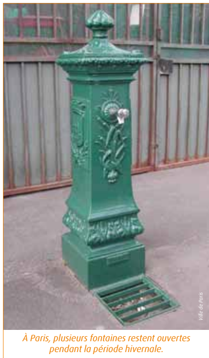
À Paris, plusieurs fontaines restent ouvertes pendant la période hivernale.