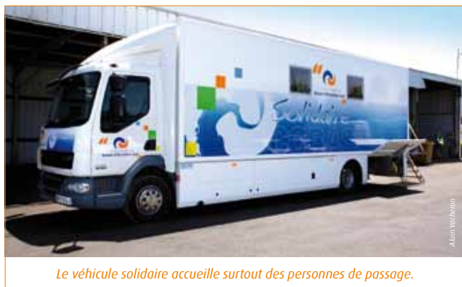
Le véhicule solidaire accueille surtout des personnes de passage.